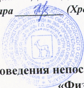
График проведения непосредственной образовательной деятельности «Физическая культура», «Музыка» на 2023 – 2024 учебный год